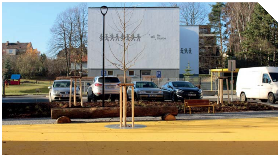
vnitroblok Na Skalce

Stavební práce realizovala společnost Eurovia CZ, a. s. v termínu od 15. dubna do 30. října. Vysoutěžená cena zakázky byla 16 735 085 Kč bez DPH. Po započítání všech provedených prací je výsledná hodnota díla 15 968 474 Kč bez DPH. Oproti vysoutěžené ceně se tak podařilo ušetřit 766 610 Kč.