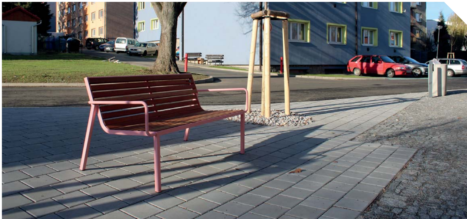
vnitroblok Na Skalce

vstupy do sklepů. K dalším pracím patřila oprava schodiště vedoucí směrem k ulici Nerudova, zpevnění pochozích ploch, zhotovení kontejnerové zástěny či úprava vstupu do mateřské školy. Nedílnou součástí revitalizace byla výsadba stromů a osazení novými lavičkami, stojany na kola a dalším mobiliářem.